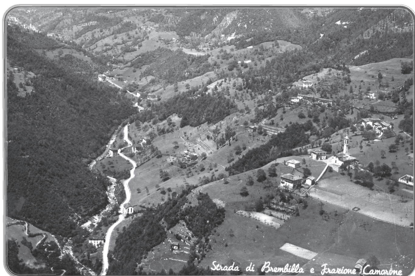
Veduta aerea del fondovalle di Brembilla.

Nella cartolina si nota sulla destra la contrada di Camorone che venne travolta dalla frana del 2002, nell'angolo in basso a sinistra serpeggia la mulattiera della Roncaglia che saliva verso la contrada di Cabonadino di Laxolo.