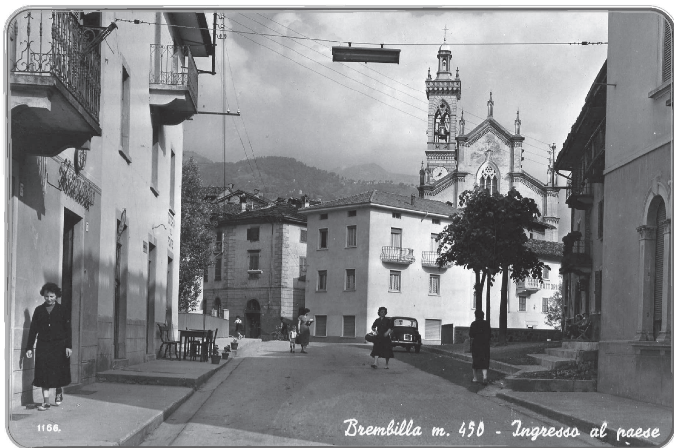
Via Roma a Brembilla.

Nella cartolina, sulla destra, si vede lo stabile dell'Albergo del Sole, ora rinnovato in Bar Pasta; sulla sinistra l'Osteria del Ponte, l'edicola della Jolanda e la tabaccheria Giacomo Carminati.