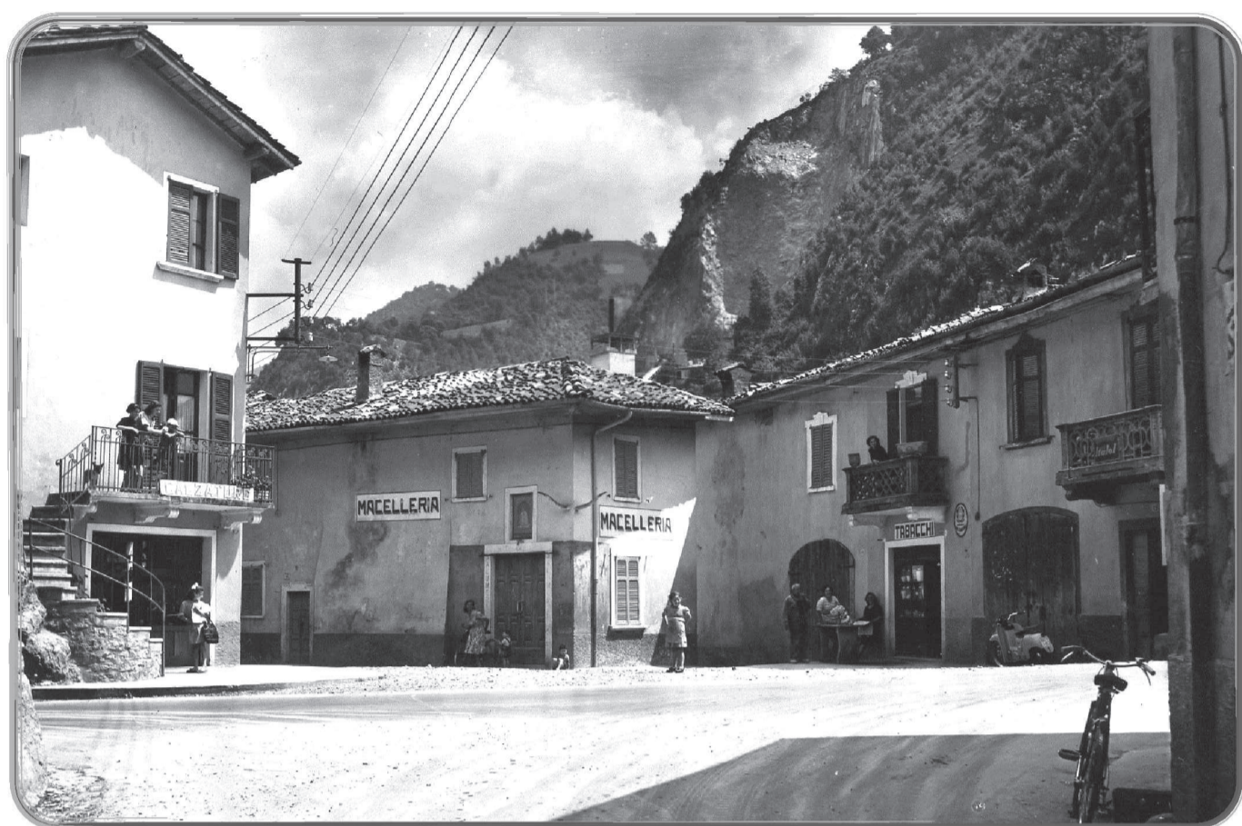
Ponti di Sedrina.

Nella cartolina si notano le numerose botteghe che furono attive fino agli anni '80. La frazione dei Ponti di Sedrina apparteneva per una parte al Comune di Brembilla poi, nel 2003, venne decretato il distacco da Brembilla e l'accorpamento al Comune di Sedrina.