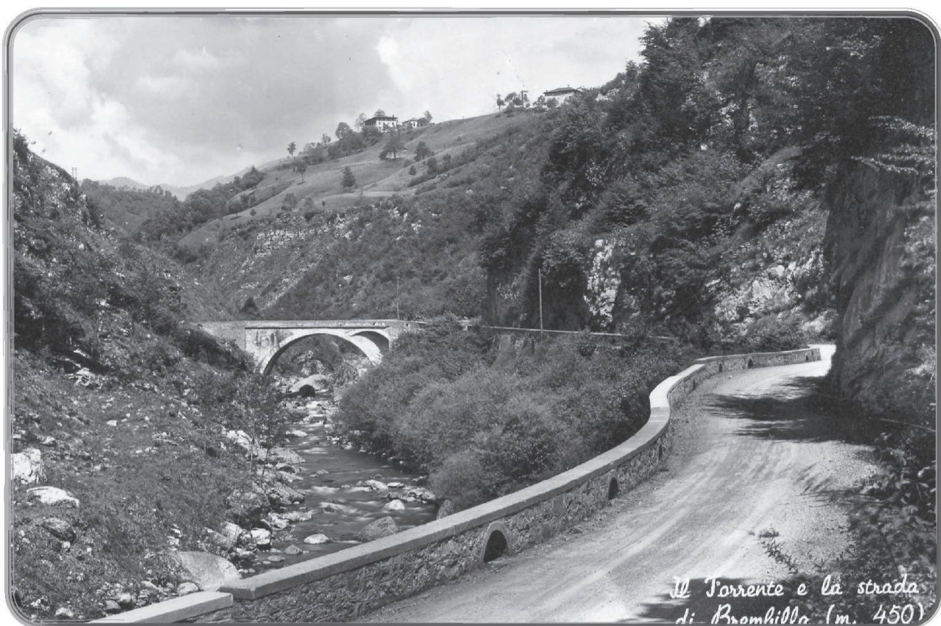
Il Torrente e la strada di Brembilla (m. 450)