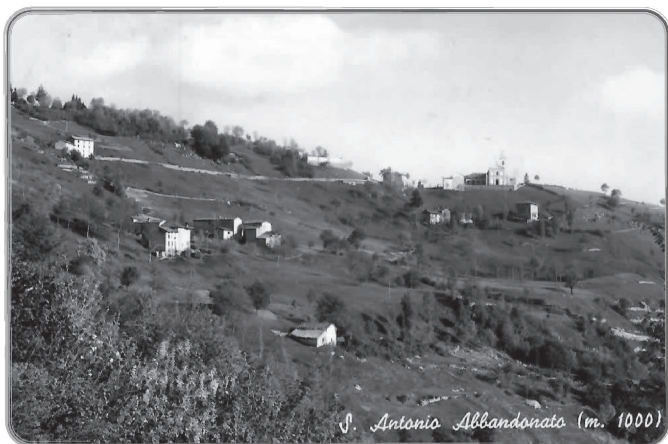
Panorama sulla frazione di Sant'Antonio Abbandonato con la Chiesa parrocchiale della frazione.