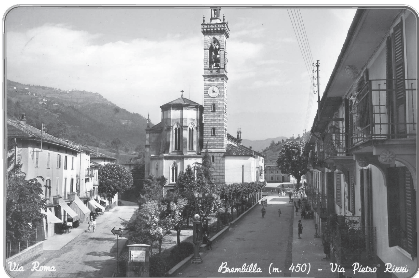
Il centro di Brembilla. Incrocio tra via Roma e via Don Pietro Rizzi con veduta del campanile della chiesa Parrocchiale.