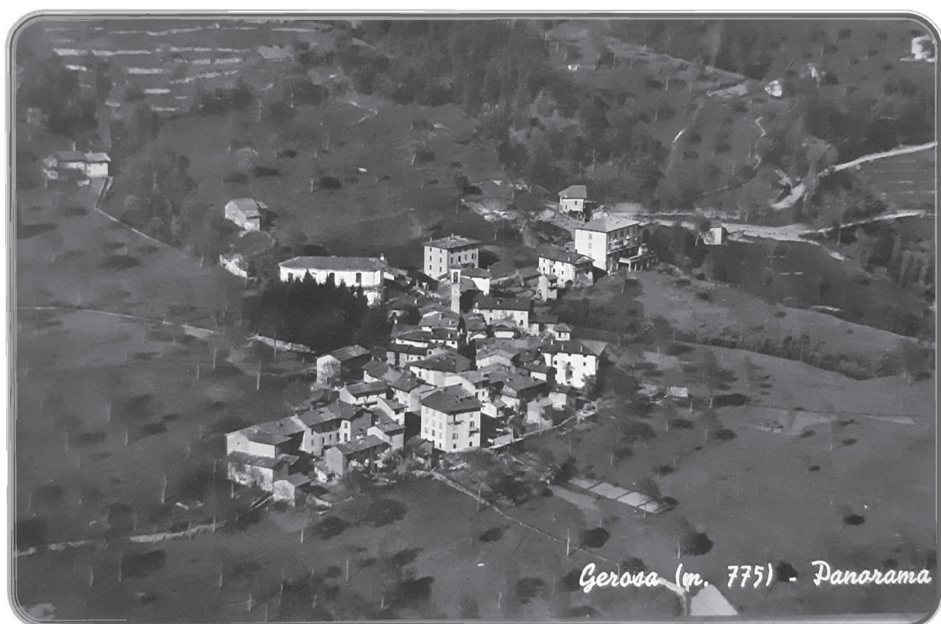
Gerosa (m. 775) - Panorama