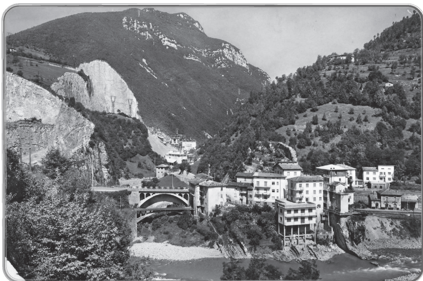
I Ponti di Sederina fotografati dal versante sinistro del Brembo.