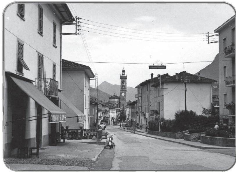
Via Libertà a Brembilla.