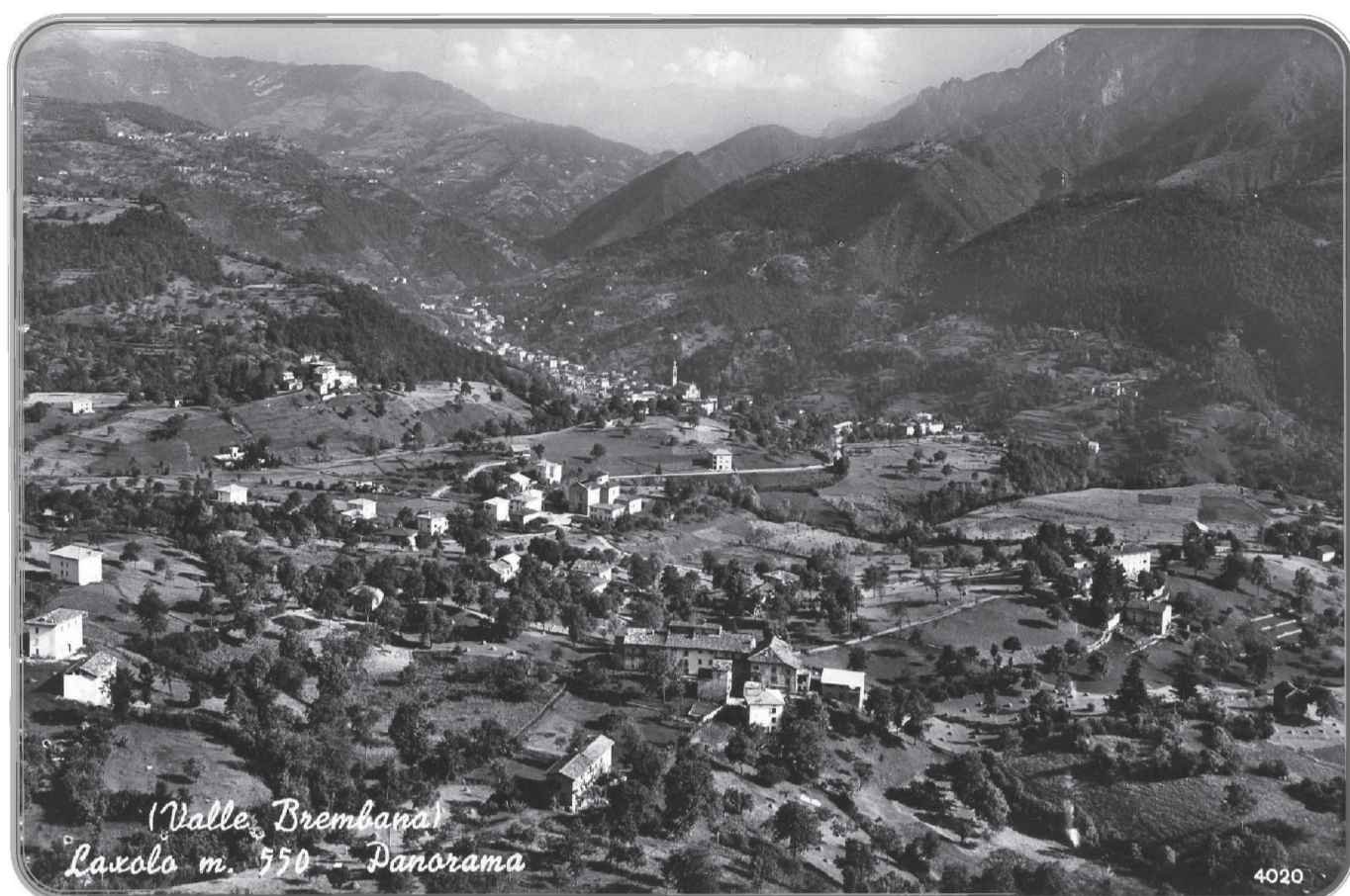
(Valle Brembana) Laxolo m. 550 - Panorama