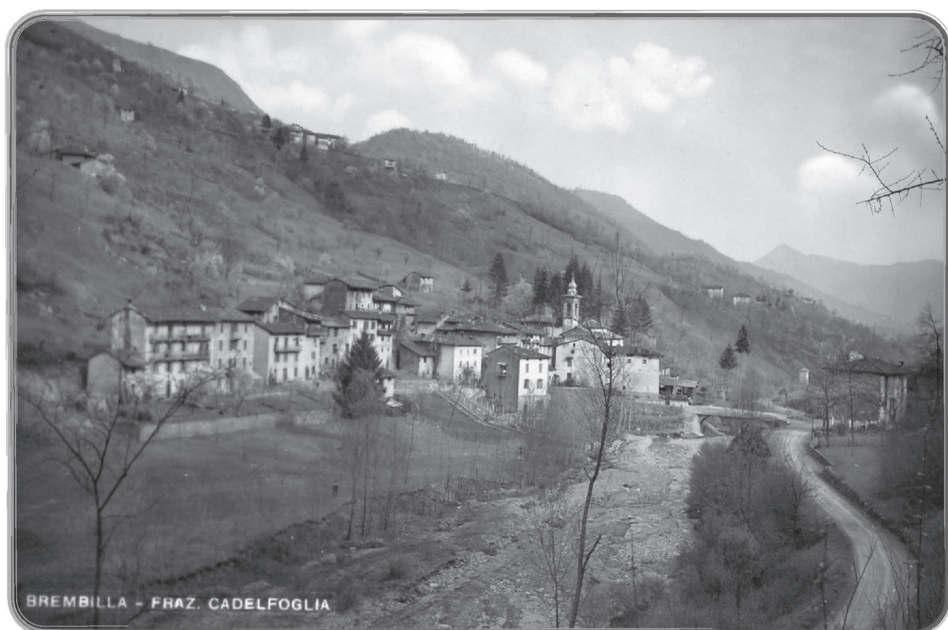
BREMBILLA - FRAZ. CADELFOGLIA