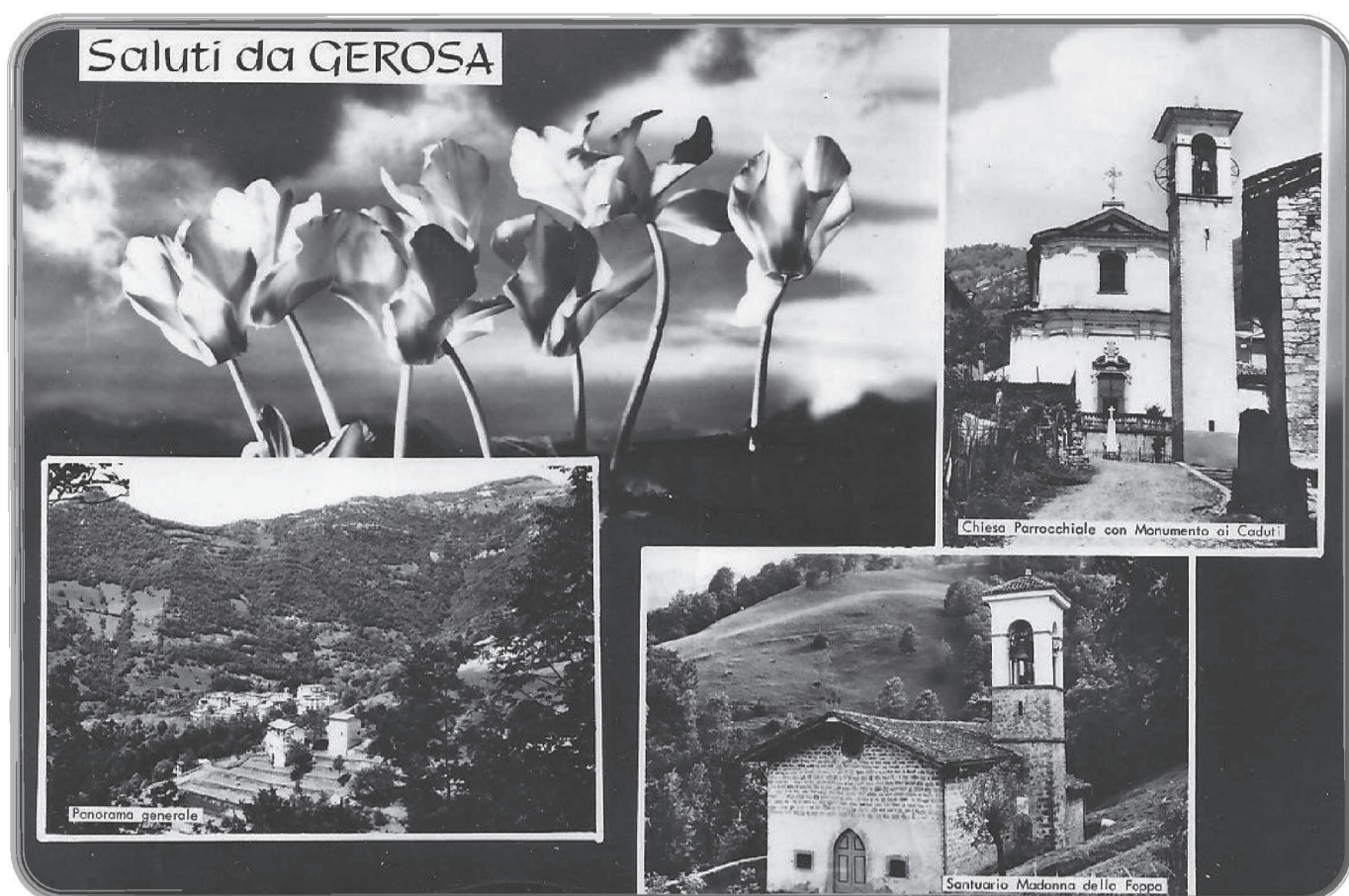
Cartolina con immagini di Gerosa.